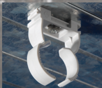
Auf Metall und auf Holz